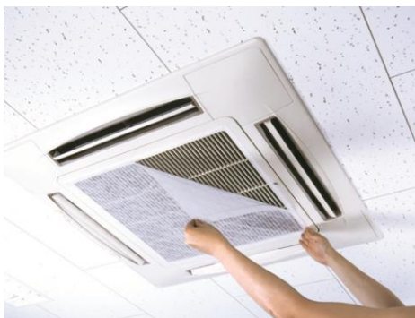
空気触媒エアコンフィルター「AIR QUEST (エアークエスト)」